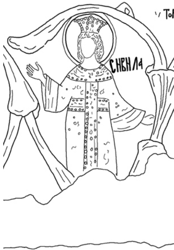
Ск. 5 Сибила

Претставата на Сибила (ск. 5), античката пророчица која е метафора на семудроста, зазема посебно место во христијанската уметност. Митологизираните (над)моќни сивили, кои се спомнуваат и во античката литература, како на пример во Вергилиевата „Ајнеида“ (Срејовиќ, Цермановиќ-Кузмановиќ 1987, 381-383), се доведувале во врска со Лозата на Христа уште во периодот на Комненската династија за што сведочат пишаните искази за незачуваната мозаична претстава на Лозата во црквата Христово раѓање во Витлеем (1169), спомената погоре (Milanović 1989, 54, n. 39). Со поновите истражувања вклучувањето на Сибила меѓу предците Христови се објаснува со нејзиното поистоветување со библиската царица од Саба или Јужна, што е научно „детектирано“ во делата на егзегетите од времето по иконоборската криза, при што родоначалничката улога ја имал, се претполага, мисловниот книжевник Георгиј Монах наречен Амартол од IX век (Давидовиќ-Радовановиќ 1973, 32-33). Всушност, оттогај името на античката пророчица се поистоветува(ло) со библиската етиопска царица од Саба (Sabah/Sheba), спомената