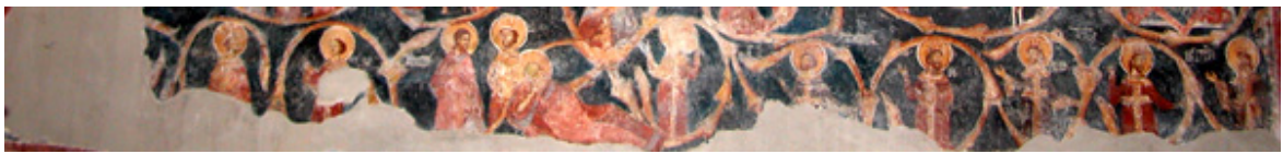
Сл. 2 Лоза Есеева (фрагмент), прва зона

доста оштетена зона се насликани единаесет фигури кои, освен една, носат царски одежди и круни околу кои е оформен кружен нимбус. Нивните физиономии се приближно идентични со исклучок на два лика. Сите имаат профетски пози и се (главно) свртени еден кон друг во парови, така сугерирајќи меѓусебен дијалог. Од овие единаесет фигури, петмина се поставени на левата, а шестмина на десната страна од Есеј (сл. 2). Според графичкиот шаблон на Лозата, сите единаесет фигури се вклучени во родословјето и, обвиткани во медалјони од акантусови ластари, се составен дел на генеалогската мрежа. На тој начин тие се визуелно означени како рамноправни предци на Христа како и останатите во приказот на неговата семејна лоза.