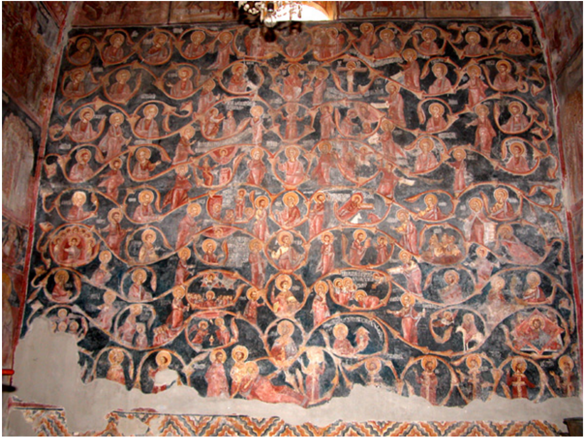
Сл. 1 Лоза Есеева, Св. Архангели во Кучевиште, припратата, западен ѕид, 1630/31

Илустрирањето на Христовото родословје според неговата библиска генеалогичка сцена наречена Лозата Есеева (сл. 1), насликана во припратата на Кучевишкиот манастир (1630/31), само по себе го легитимира авторот како опитен зограф со видна богословска образование. Познато е, имено, дека екстензивната иконографија на Лозата Есеева е вистинска реткост и претставува една од најкомплексните теми во источнохристијанската уметност. Кучевишкиот примерок е единствената претстава на Христовата генеалогичка сцена во Македонија во доцниот среден век. Лозата е насликана на западниот ѕид, веднаш под четирите натални сцени (4. икос, 4 кондак, 5. икос и 5. кондак) на Богородичиниот акатист. Нејзиниот сложен костур е сочинет од орнаментален растителен преплет на акантусова лоза, во која се обединети осумдесет и осум поединечни фигури и дваесет и две сцени. Насликана со фасцинантна опсежност презентирани на 25м 2 , во Лозата прегледно се следат седум вертикални низови. Почетната точка во дното на средишната вертикала е претставата на Есеј - коренот на Лозата, а пак крајната/исходна кота е самиот Христос, претставен на врвот, под кој е поставена фигурата на Богородица. Оваа централна вертикала содржи шест старозавентни праведници и цареви, Христови предци по тело. Лево и десно од средишната оска, се структурирани по три ниски од ликови и сцени, врамени со стилизирани