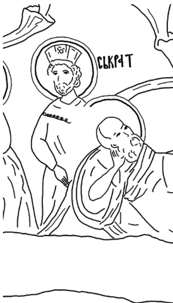
Ск. 3. Сократ

Претставата насликана лево до Есеј, која единствена не е вrameна со акантусова рамка, според добро зачуваната легенда (СЪКРАТ) е илустрација на фигурата на Сократ (ск. 1. д; ск. 3). До него е насликана фигура, единствена во низата без круна на главата, чијшто лик многу потсетува на Христовиот (ск. 1. г). Нејзиниот натпис, кој содржи повеќе букви од другите имиња, е сосема замачкан и целосно нечитлив. Следната претстава влево е млад голобрад момок со затворена круна на главата и тешко читлива натписна ознака (...ΛΠΡ) (ск. 1. в), како впрочем и натписот на петтата фигура која има фригиска капа на главата (ск. 1. б). Последната, шестата фигура на левата страна (ск. 1. а) е сосем уништена.