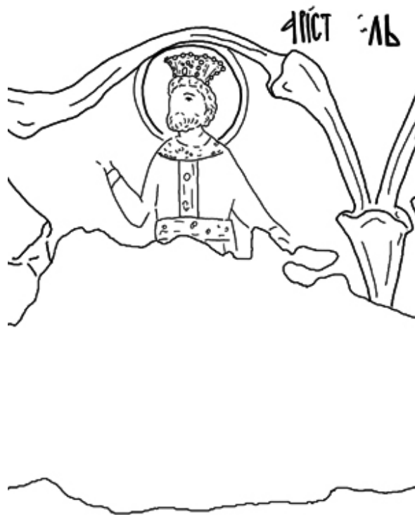
Ск. 2. Аристотел

медалјонот, е многу оштетен што сериозно ја отежнува нејзината идентификација. На крајот на северниот/десниот дел од првата зона е поставен Плутарх (ПΛΥΤΑΡΧ) (ск. 1. j).