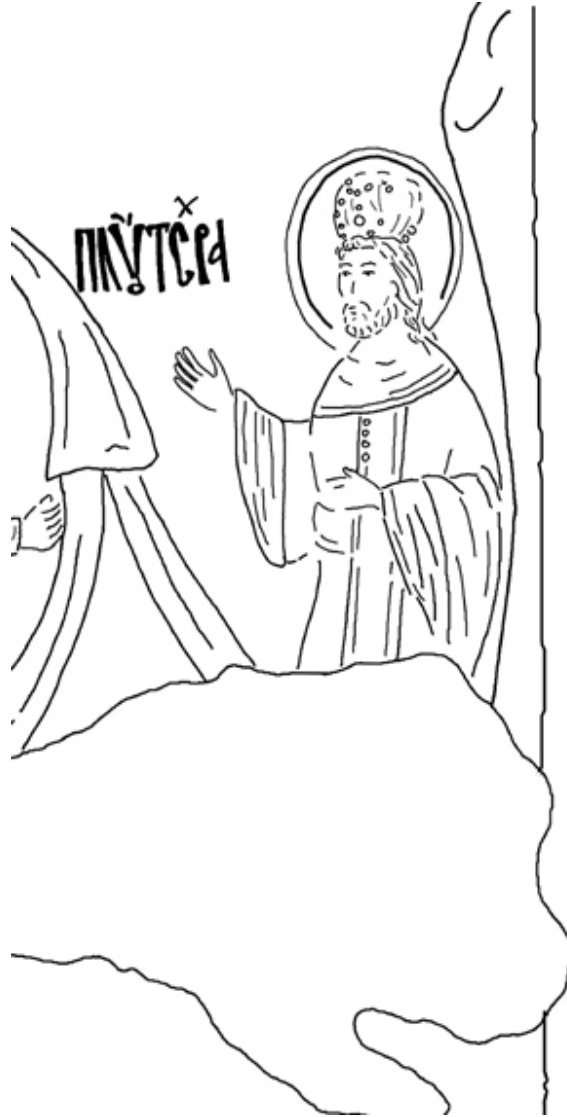
Ск. 4 Плутарх